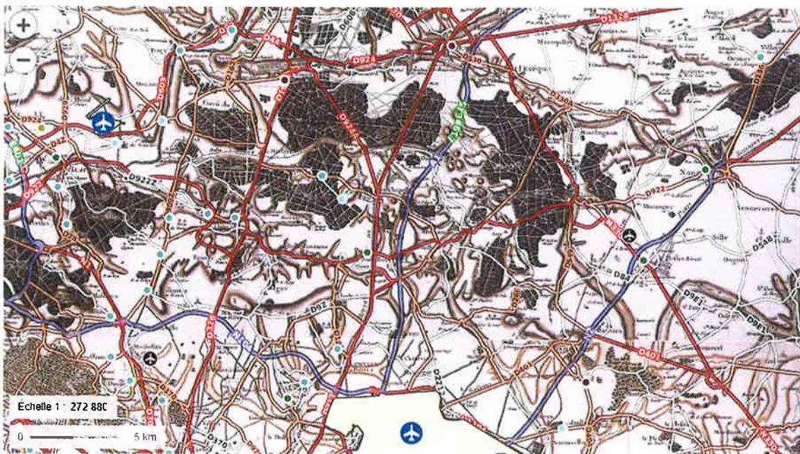
Carte de Cassini (XVIII e siècle), axes routiers, gares ferroviaires et transport aérien.

Avec la présence du troisième pôle récréatif de France après Disney et le Puy du Fou (Parc Astérix plus de 2,5 millions de visiteurs par an), il est incontestable que le tourisme constitue un important levier de développement économique et d'attractivité pour l'Espace de Rayonnement Touristique de Chantilly-Senlis. Ce développement est notamment dû à une accessibilité remarquable et un bassin de chalandise hors norme.